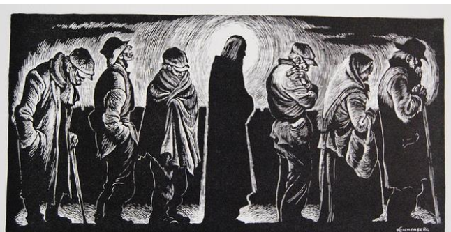
(アイヘンバーク「炊き出しの列にならぶイエス」)